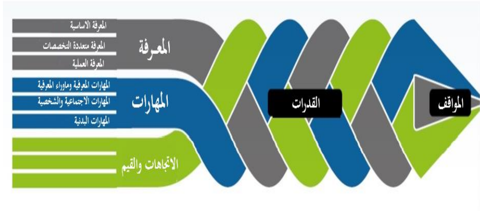
شكل 1 منظمة التعاون الاقتصادي والتنمية (OCED, 2018, p.4)

واستجابة لتحقيق ما دعت إليه تلك الأطر؛ سارعت الأنظمة التعليمية إلى تبني هذه المهارات في بنية مناهجها، وتطويرها بما يتناسب ومتطلبات العصر، ويوضح الشكل الآتي مثالان على تلك المناهج: